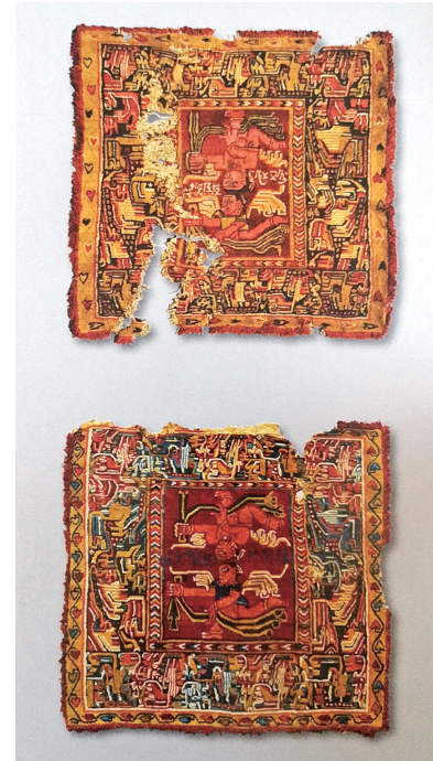
隋代(581-618年) 破案追缴 出自洛浦县比孜力佛寺遗址 和田博物馆藏