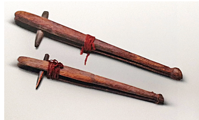
夏至商代早期(约公元前2070-前1500年) 克里雅河北方墓地采集 和田博物馆藏