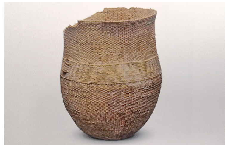
夏至商代早期(约公元前2070-前1500年) 克里雅河北方墓地采集 和田博物馆藏