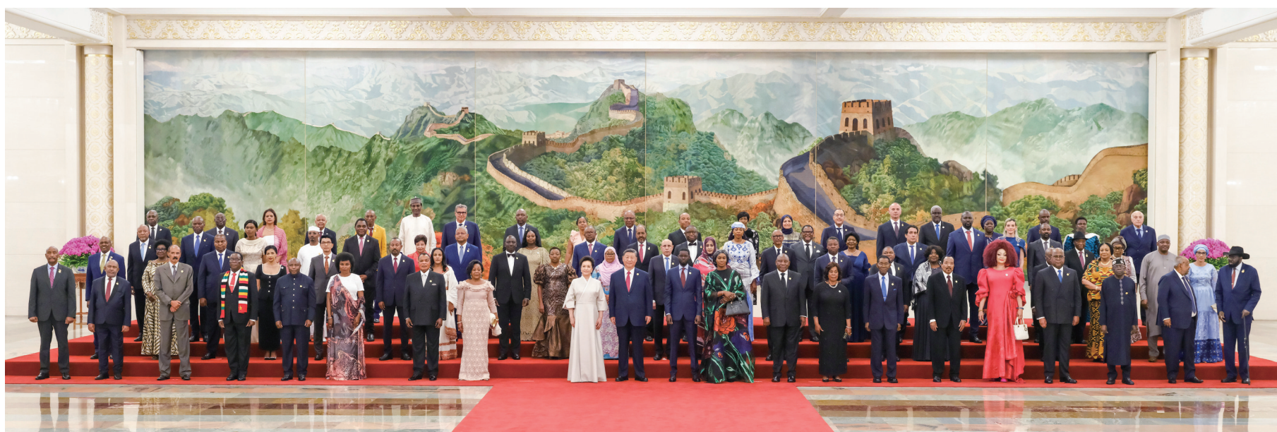
9月4日晚,国家主席习近平和夫人彭丽媛在北京人民大会堂举行宴会,欢迎来华出席中非合作论坛北京峰会的非方及国际贵宾。这是宴会前,习近平和彭丽媛同贵宾们集体合影留念。