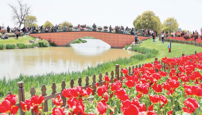
4月13日,游客在江苏省盐城市大丰区荷兰花海景区内赏花游玩。春日花开艳丽,人们纷纷寻芳踏春。

4月11日晚,第三届新疆文化艺术节优秀剧目展演活动之一,大型交响音乐会《黄河》在乌鲁木齐奏响。小提琴、圆号、长笛……数十种乐器齐鸣,天籁之音在天山脚下回荡,观众沉浸其中,仿佛置身于黄河岸边,感受着母亲河的磅礴气势。 《黄河大合唱》是冼星海影响力最大的大型合唱声乐套曲,由诗人光未然以黄河为背景创作歌词,热情讴歌中华民族悠久历史与不屈斗争精神,塑造出巨人般的民族英雄形象。全曲由《黄河船夫曲》《黄河颂》《黄河之水天上来》等八个乐章构成,各乐章既独立成篇,又在内容、形式和形象上形成鲜明对比。同时,几个基本音调贯穿始终,紧密围绕中华民族解放斗争主题,将整部作品融为一体。 当激昂的《黄河船夫曲》响起,观众仿佛看到船夫们与狂风恶浪搏斗的场景;《黄河颂》的雄浑旋律,让观众感受到黄河的壮丽与中华民族的伟大;《黄河怨》则让观众体会到战争给人民带来的苦难。乌鲁木齐市民马应忠带着孙子来到现场,“这部作品让我想起父辈的故事,音乐里的坚韧和豪情震撼人心,希望年轻人能守护这份精神。” 整场演出中,观众的情绪随着旋律的起伏而波动。时而,激昂的乐章让观众热血沸腾;时而,深情的旋律让大家热泪盈眶。每一次旋律的转折,都伴随着观众热烈的掌声。乌鲁木齐交响乐团指挥邓文欢在演出结束后感慨:“经典作品往往很难演绎,因为它们承载着深厚的历史意义和民族情感。特别是在乐曲编排上,我们需要更多的默契,也要深刻理解作品背后的精神内涵。” 石榴云/新疆日报记者 宋海波