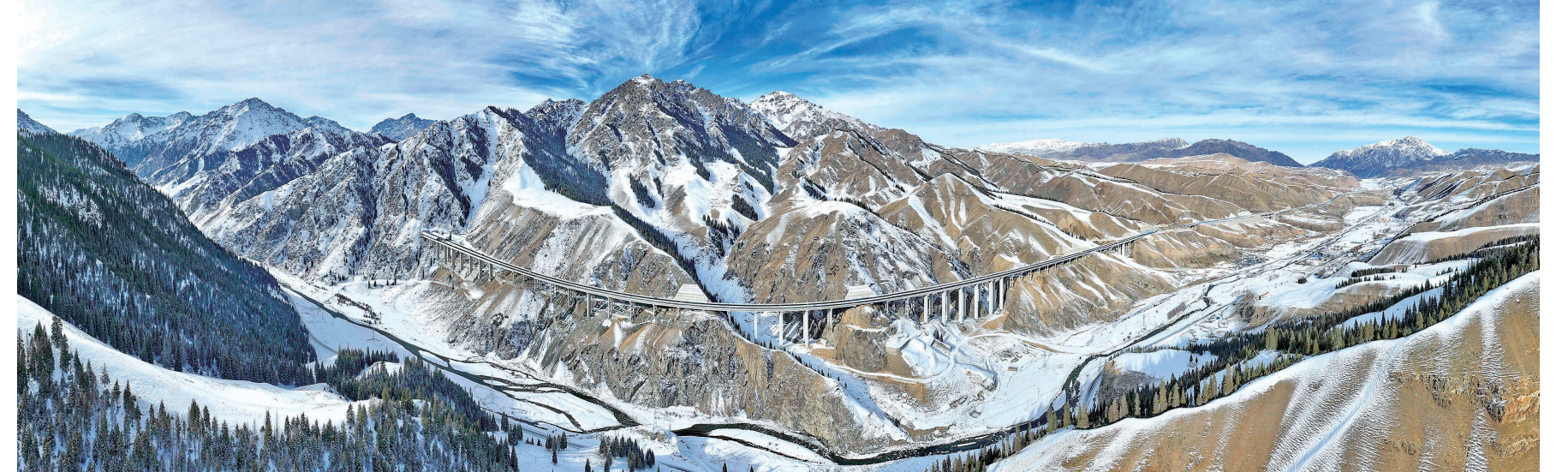
桥隧相连的乌尉高速公路穿越天山山脉(12月20日摄,无人机全景照片)。世界最长高速公路隧道——天山胜利隧道及其所在的G0711新疆乌鲁木齐至尉犁高速公路(简称“乌尉高速”)即将实现全线通车。届时,天山以北的乌鲁木齐至天山以南的库车的通行时间将从7小时缩短至3小时左右。天山胜利隧道全长22.13公里,是目前世界最长高速公路隧道。