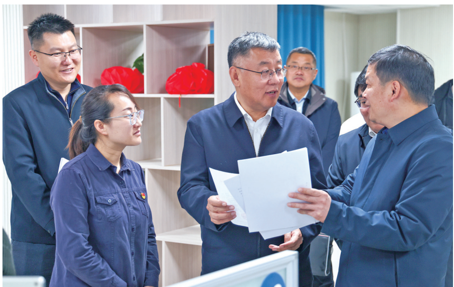
12月26日,地委书记王鲁军在地区12345便民热线中心调研。

“12345是民生工程,要全量收集、全量解决好群众急难愁盼的各类诉求,形成工作闭环,赢得群众信赖。”王鲁军走进地委社会工作部,听取地区接诉即办中心、12345便民热线中心运行情况汇报,与工作人员深入交流,了解群众矛盾纠纷诉求排查化解、党建引领基层治理、社会工作服务和志愿服务等工作情况。他要求,要努力践行新时代党的群众路线,突出抓好