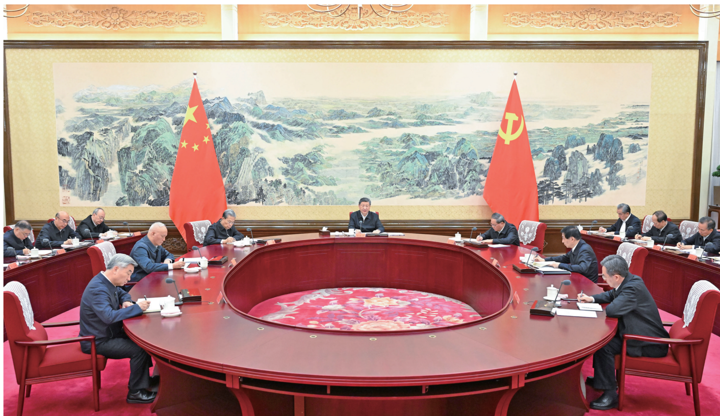
12月25日至26日,中共中央政治局召开民主生活会,中共中央总书记习近平主持会议并发表重要讲话。