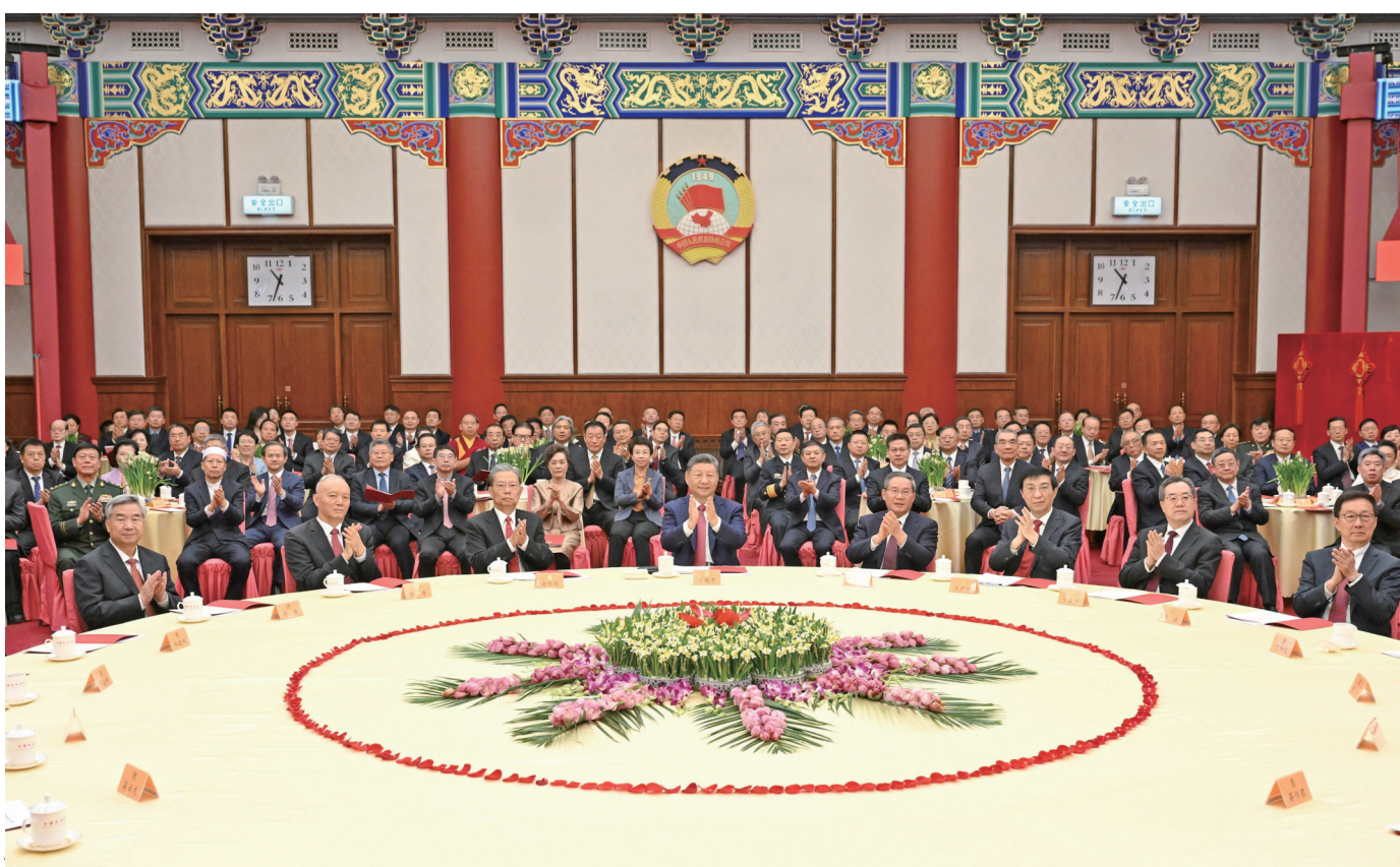
12月31日,全国政协在北京举行新年茶话会。党和国家领导人习近平、李强、赵乐际、王沪宁、蔡奇、丁薛祥、李希、韩正出席茶话会并观看演出。

习近平代表中共中央、国务院和中央军委,向各民主党派、工商联和无党派人士,向全国各族人民,向香港同胞、澳门同胞、台湾同胞和海外侨胞,向关心和支