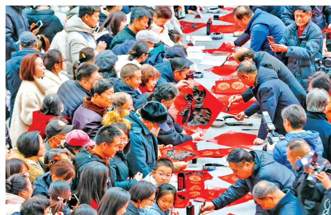
1月22日,文艺工作者在天津市滨海文化中心为市民现场书写春联和“福”字。