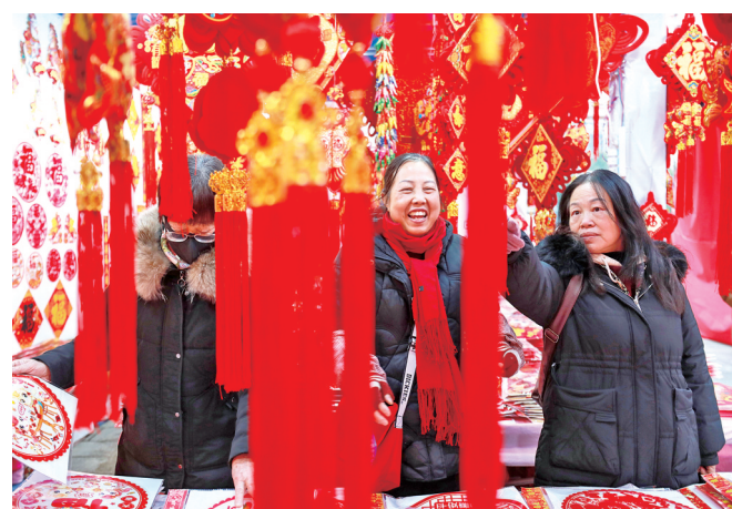
1月22日,市民在贵州省都市文峰广场年画市场挑选春节饰品。