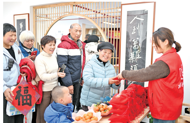
1月22日,居民在江苏省昆山市昆苑社区新时代文明实践站领取新年福袋。