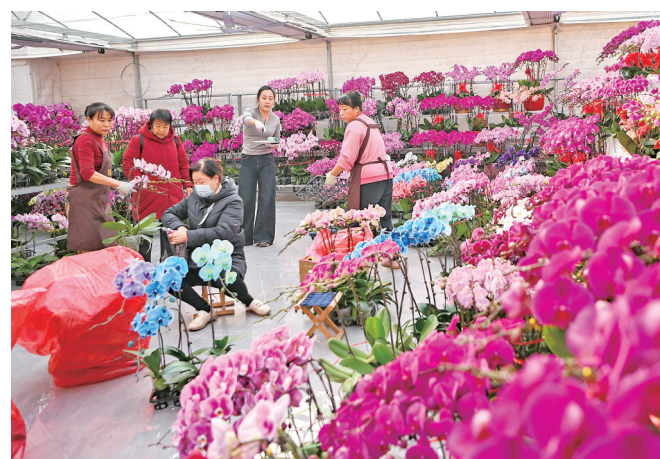
1月22日,市民在山东省青岛市花卉苗木交易中心选购鲜花。