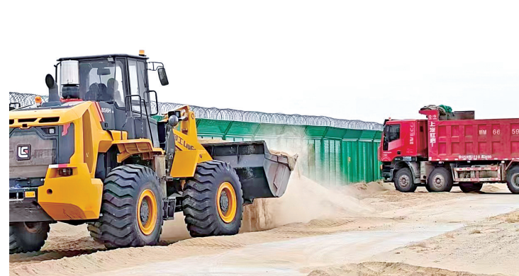
工程机械对机场围界的积沙进行清理。

此次清沙工程不仅实现了安全隐患清零,更创下了降本增效的良好成效。通过协调第三方免费提供专业施工设备与技术支持,结合员工自主参与人工清理,大幅降低了工程成本,实现了“安全保障+成本控制”的双重目标。经专业检测人员现场核校,整治后的围界高度、周边障碍物间距等各项指标均完全符合《运输机场运行安全管理规定》的相关要求。