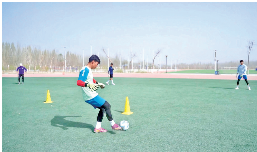
训练场上,和田足球队队员正在训练。