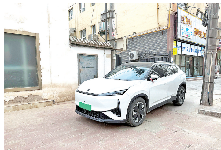
私家车占用人行道停放,给居民出行带来不便。

根据相关规定,人行道禁止机动车停放,希望相关部门加强管理,及时整治违停乱象,保障市民出行安全。