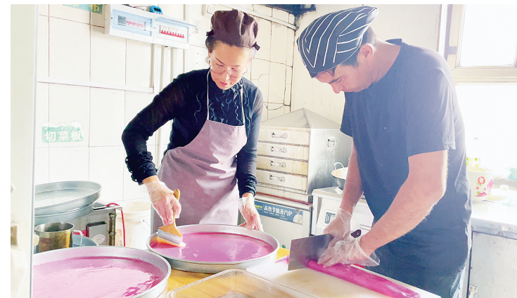
夫妻俩精心制作果蔬彩色凉皮。