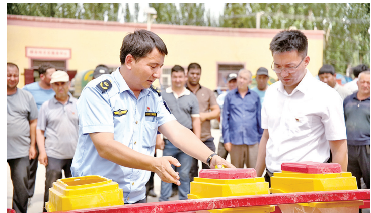
6月3日,在和田市吐沙拉镇托格热克村,市农业农村局工作人员正在对夏收农机具进行逐一调试保养。

据统计,今年和田市共有2010台(架)各类农机设备投入“三夏”作业,涵盖拖拉机、联合收割机、脱粒机、播种机等多种农机具,充足的农机储备,为夏收工作高效推进提供了设备保障。