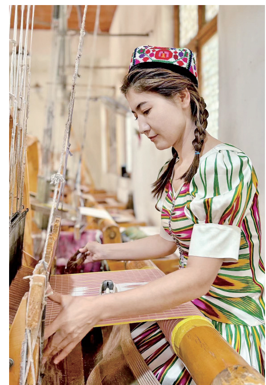
工人编织艾德莱斯绸。 模特身穿艾德莱斯绸服装走秀。

祖辈栽桑蚕吐丝,抽丝织作绣神奇。艾德莱斯绸是新疆特有的一种织锦,轻盈飘逸,色彩分明,将生活元素织入图案,寄托着新疆各族人民对生活的热爱,体现着时代的智慧,被誉为“和田三宝”之一。2008年,艾德莱斯绸织染技艺被列入第二批国家级非物质文化遗产代表性项目名录。