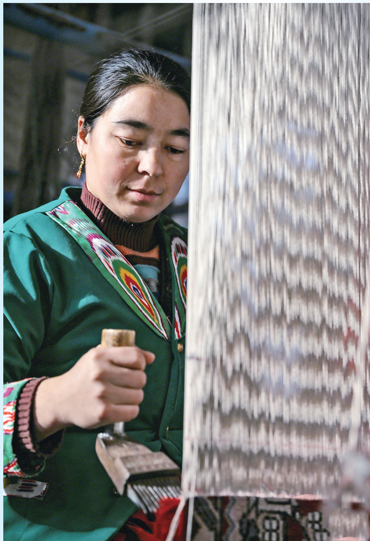
工人正在编织地毯。