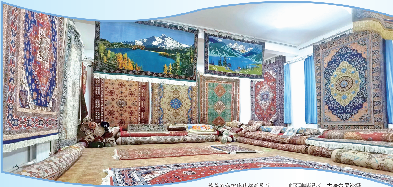
精美的和田地毯摆满展厅。