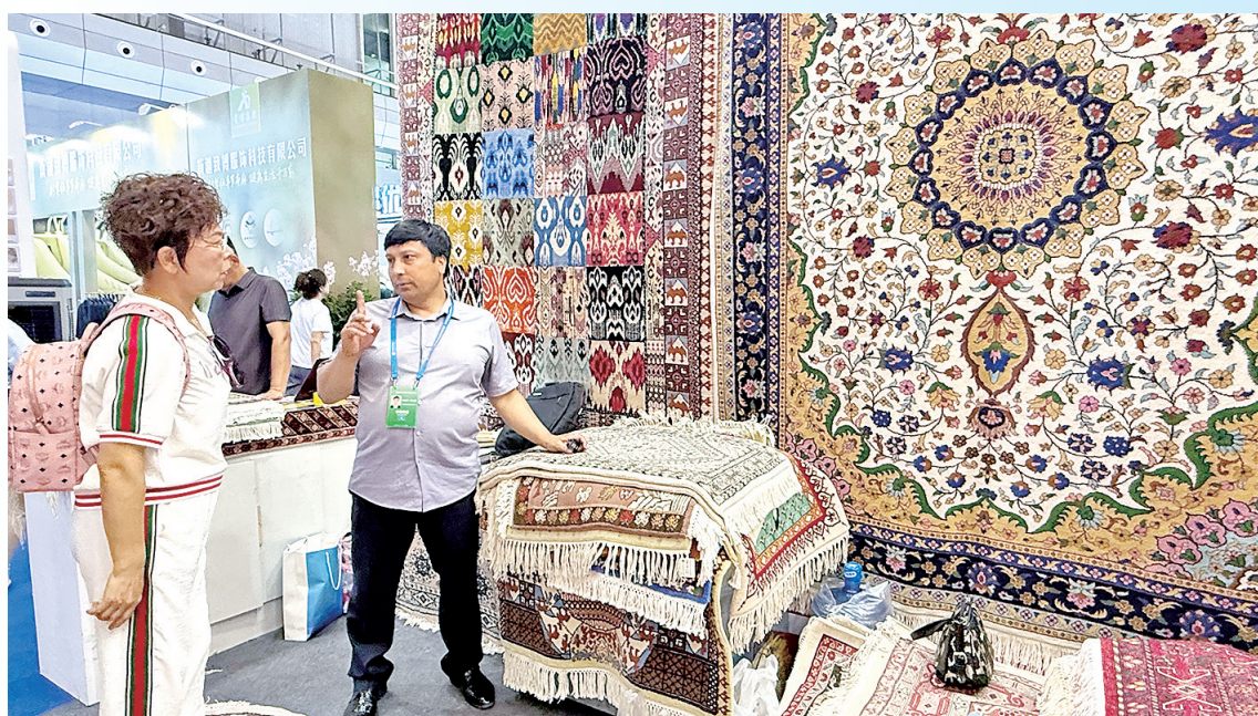
向客商介绍和田地毯。

为传承这项手工编织技艺,以“纳克西湾”为名,成立了公司,注册了品牌,打造了本色地毯、花色地毯、真丝纯毛合织地毯、艺术挂毯四大系列产品集群,花色达100多种,产品主要销往国内其他省份及美、英、法等国。