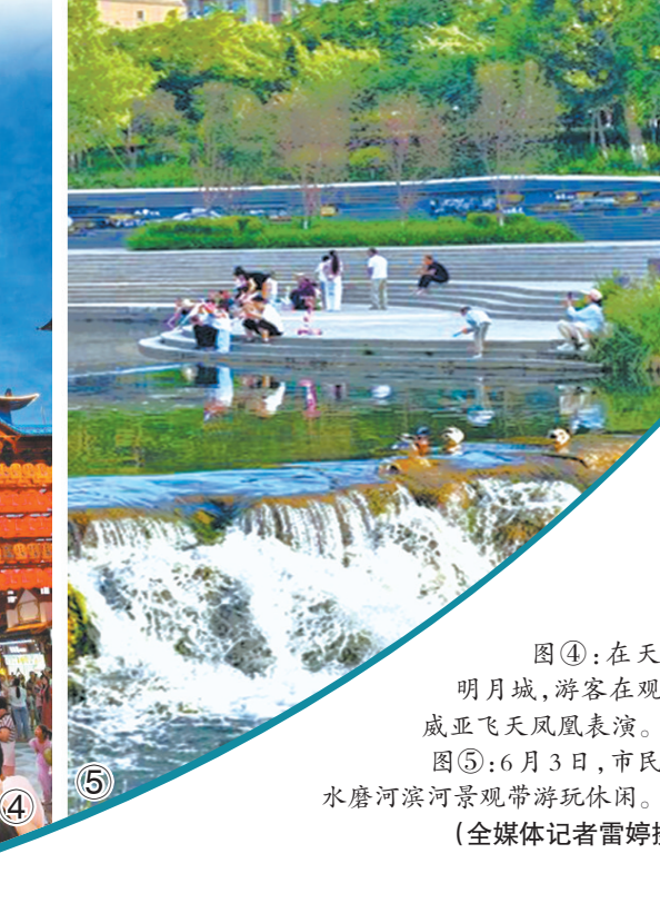
图④：在天山明月城，游客在观看威亚飞天凤凰表演。 图⑤：6月3日，市民在水磨沟滨河景观带游玩休闲。