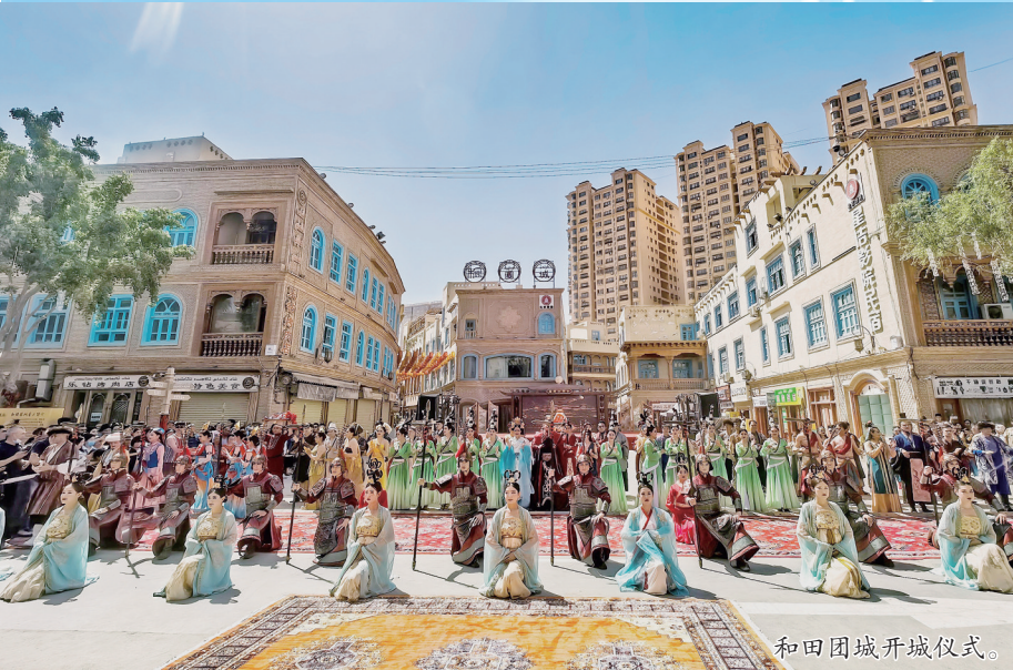
和田古城开城仪式