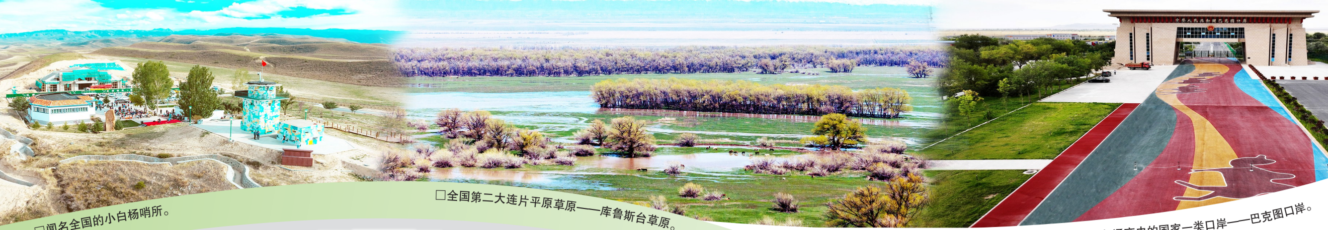
□闻名全国的小白杨哨所。