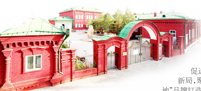
□全国重点文物保护单位地区博物馆。

近年来，塔城地区全方位推动文化事业与文旅产业提质升级、实现跨越式发展。坚持在品牌打造促进文旅融合中擎画振兴新局，聚焦“油画塔城、草原圣地”品牌打造，景区品质、产业规模、市场效益同步提升。